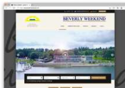
Beverly Weekend Ferienwohnungen Präsentation und Buchungssystem www.beverlyweekend.com