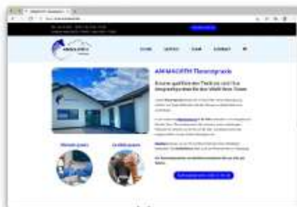
ANIMALVith Tierarztpraxis Online Visitenkarte www.animalvith.be