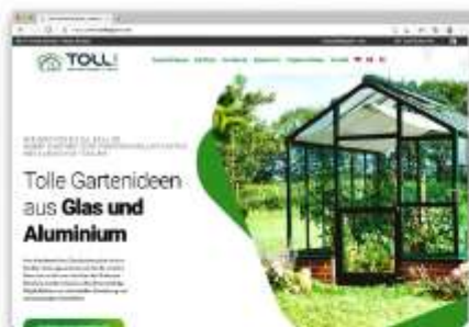
TOLL! Belgium: Gewächshäuser, Pavillons, Hochbeete... Firmen- und Produktpräsentation www.tollbelgium.com